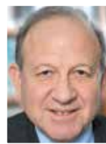
Henri STERDYNIAK Économiste, signataire du manifeste d'économistes atterrés, auteur de «Présidence Sarkozy, quel bilan ?»