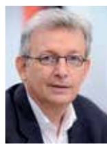
Pierre LAURENT Sénateur et Secrétaire national du PCF. Auteur de «99%».