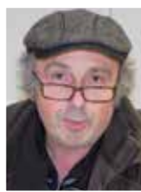
Gilles BALBASTRE Réalisateur et journaliste (les nouveaux chiens de garde, Vérités et mensonges sur la SNCF)