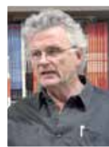
Gérard MORDILLAT écrivain de plus de 30 ouvrages (les Vivants et les morts, Vive la sociale, la Brigade du rire...) et cinéaste (Billy the Kick, le Grand retournement...)