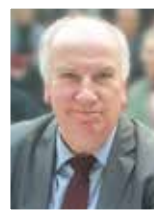
Éric BOCQUET Sénateur, co-auteur avec Alain Bocquet de «Sans domicile fsc»